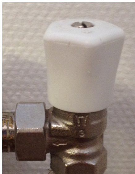
Ny type: anbefales