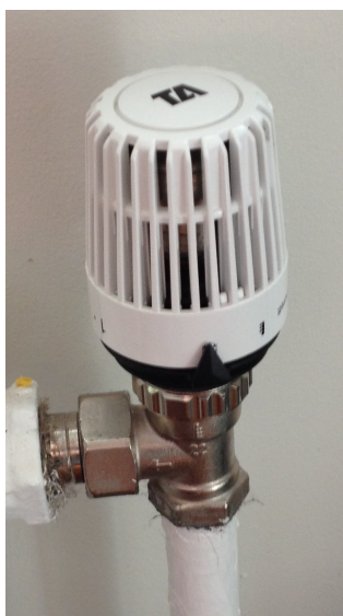
Reguleringsventil med termostat.

Innløpet til radiator smalere så røret som fører vannet inn blir lettere tett.